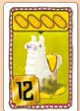
48 Lamakarten (je 16 mit Kakao, Mais und Kartoffeln)