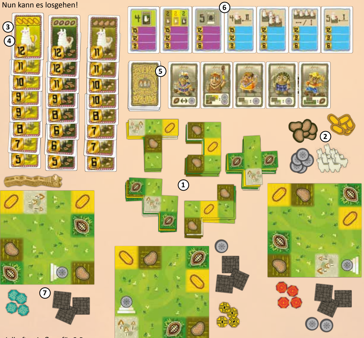
beispielhafter Aufbau für 3 Personen