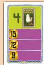
22 Aufgabenkarten (10 blaue, 6 lila- und 6 goldfarbene)