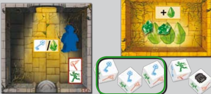
Beispiel: Frank hat die 3 nötigen Schlüssel erwürfelt und kann somit aus dem Tempel entfliehen.

Seid ihr entflohen, befindet ihr euch in Sicherheit und dürft einen Würfel an einen beliebigen anderen Abenteurer im Tempel weitergeben . Dieser darf ihn ab sofort verwenden.