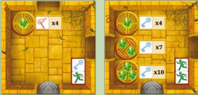
Kammer mit 1 Steinsymbol Kammer mit 1, 2 und 3 Steinsymbolen

Es gibt zwei Arten von Kammern, in denen ihr magische Steine aktivieren könnt: