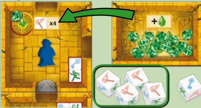
Beispiel: Frank hat 4 Fackeln erwürfelt und aktiviert den magischen Stein in der Kammer. Er legt einen Stein von der Steinablage in die Kammer.

Befindet ihr euch in einer Kammer, müsst ihr die entsprechende Anzahl an solchen Fackel- oder Schlüsselsymbolen erwürfeln, um entsprechend viele magische Steine zu aktivieren. Um anzuzeigen, dass ein Stein aktiviert wurde, legt ihr ihn von der Steinablage auf die entsprechende Kammer.