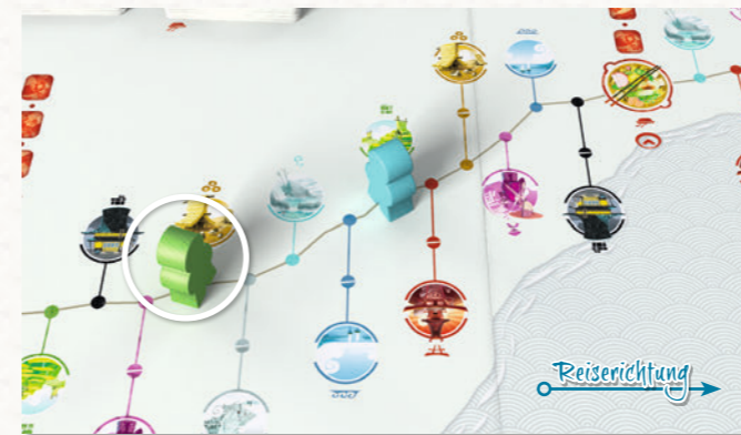
Der grüne Reisende steht auf der Straße am weitesten hinten; also ist er an der Reihe.

Manchmal ist der Reisende, der gerade dran war, auch nach seinem Zug noch der Letzte. In diesem Fall ist er sofort noch einmal an der Reihe.