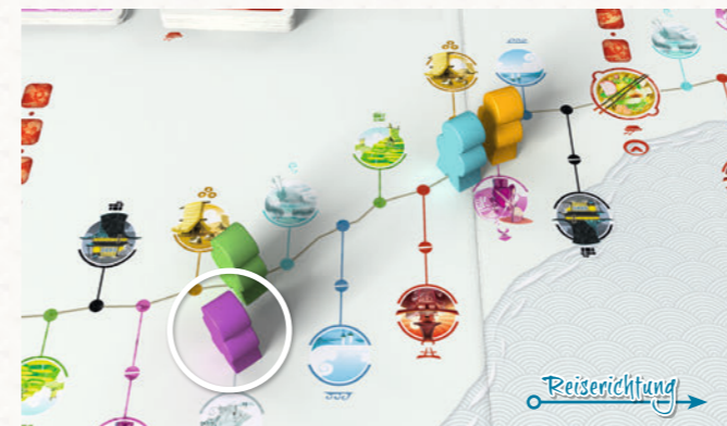
Der violette Reisende ist weiter hinten als der grüne Reisende; deshalb ist er am Zug.