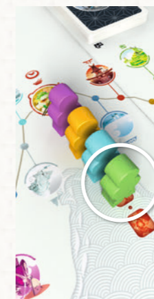
Der grüne Reisende wird als Erster das Gasthaus verlassen.

Wenn der erste Reisende bei einem Gasthaus ankommt, zieht er so viele Mahlzeitenkarten, wie Spieler teilnehmen, plus 1. (In einer Partie zu dritt zieht er also beispielsweise 4 Karten.)