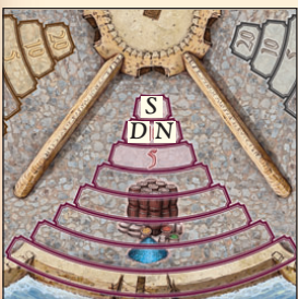
Beispiel: Sue (S) erhält 30 Florin (10 plus den Bonus von 20). Bob (B) bekommt nichts. Nancy (N) und Doug (D) erhalten jeweils 12 Florin (5 / 2 plus den Bonus von 10 Florin).