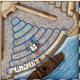
Beispiel: Sue (S) erhält 10 Florin. Bob (B), Nancy (N) und Doug (D) teilen sich 5 Florin: jeder erhält 1 Florin.

Der Einkäufer mit dem wenigsten Geld ist der neue Startspieler. Er wirft alle 36 Plättchen wieder in den Beutel und mischt sie gut. Dann legt er entsprechend der Spielerzahl Plättchen beiseite und stellt das erste Paket für die Versteigerung zusammen. Haben mehrere Spieler gleich wenig Geld, wird der Startspieler zufällig bestimmt.